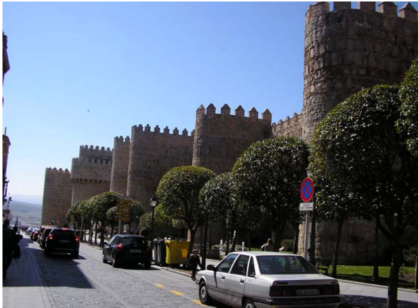
Murallas de Ávila de los Caballeros